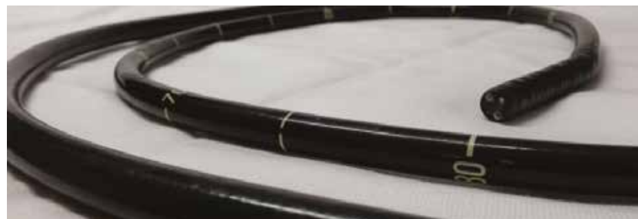
Voorbeeld van een endoscoop

Om een maagscopie te kunnen uitvoeren moet het paard een lege maag hebben, anders is het niet mogelijk om de maagwand te bekijken. Daarom moet het paard voor het onderzoek vasten; 18 uur geen voedsel en 6 uur geen water. Op basis van alleen vage symptomen en zonder verder onderzoek kan geen definitieve diagnose gesteld worden. Wel kan het vermoeden ontstaan dat het paard een maagzweer heeft. Soms kiezen paardenartsen om hun behandeling te starten op basis van deze vermoedens. De symptomen van een paard met maagzweren zullen bij een behandeling met medicijnen binnen 3 á 4 dagen zichtbaar moeten verbeteren.