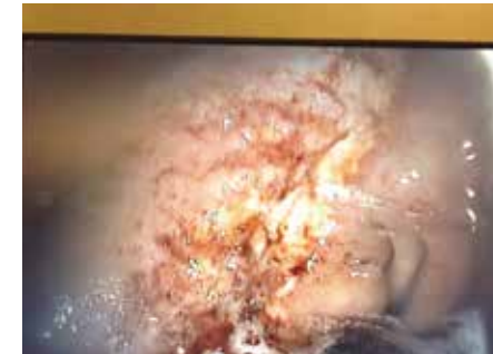
Maagzweer zichtbaar via endoscopie

Het slijmvlies van de maag is verdeeld in twee delen. Het bovenste deel is klierarm (het squameuze deel) en