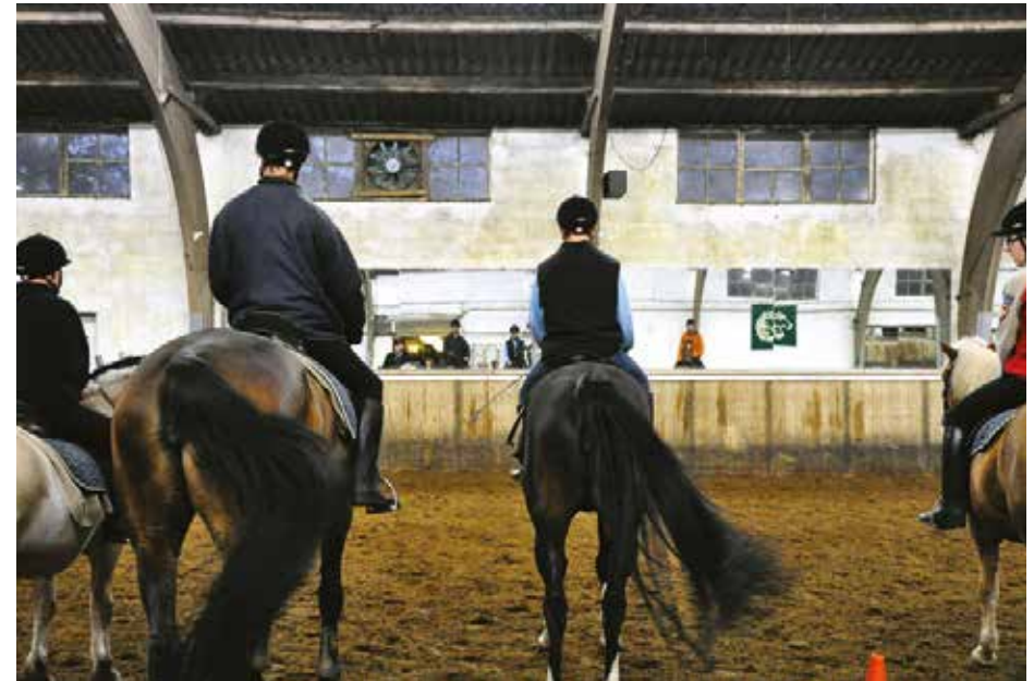
Een gevorderde gehandicaptenles op manege Kennemergaarde