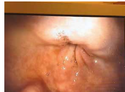
Maaguitgang richting dunne darm

In vergelijking met andere dieren hebben paarden een kleine maaginhoud. Dat komt omdat de functie van de maag bij een paard anders is. Bij het paard dient de maag als een soort doorgeefluik naar de darmen. Dat doorgeefluik is constant in gebruik. Bij veel andere dieren, zoals bij koeien, heeft de maag ook een bepaalde opslagcapaciteit. Bij paarden is dat dus niet het geval. Gezien de omstandigheden waarin het paard in de vrije natuur leeft, is dat prima. Het paard eet dan immers het overgrote deel van de dag constant kleine beetjes. Het gaat mis wanneer wij de natuurlijke voedingsopname van het paard niet goed genoeg nabootsen. Veel van onze paarden krijgen slechts een paar keer per dag een grote portie eten te verwerken. Buiten die paar