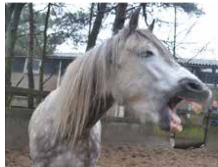
Een gapend paard kan een teken zijn van de aanwezigheid van maagzweren

In de tijd dat er nog geen 'endoscoop' (slang met camera) was om in de paardenmaag te kijken, werd de aanwezigheid van maagzweren onderschat. De meeste paarden met maagzweren vertonen immers nauwelijks of geen verschijnselen. Daarnaast zijn de symptomen vaak zeer uiteenlopend en kunnen ze ook op andere problemen duiden.